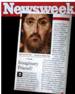
The God Who Wasn't There trên tờ Newsweek

Báo chí đã nói gì về The God Who Wasn't There :